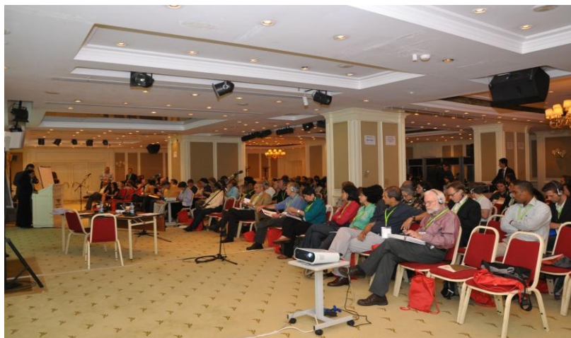
Figura 1: Salón Principal del Hotel Larespark, Primer Día de la Asamblea Mundial 2

El lugar elegido para realizar las sesiones plenarias de la Asamblea Mundial fue el Salón Principal del Hotel Larespark. El Hotel está situado cerca de la Plaza Taksin, en el centro de Estambul. Para el evento, se facilitaron traducciones en turco, inglés, francés y español.