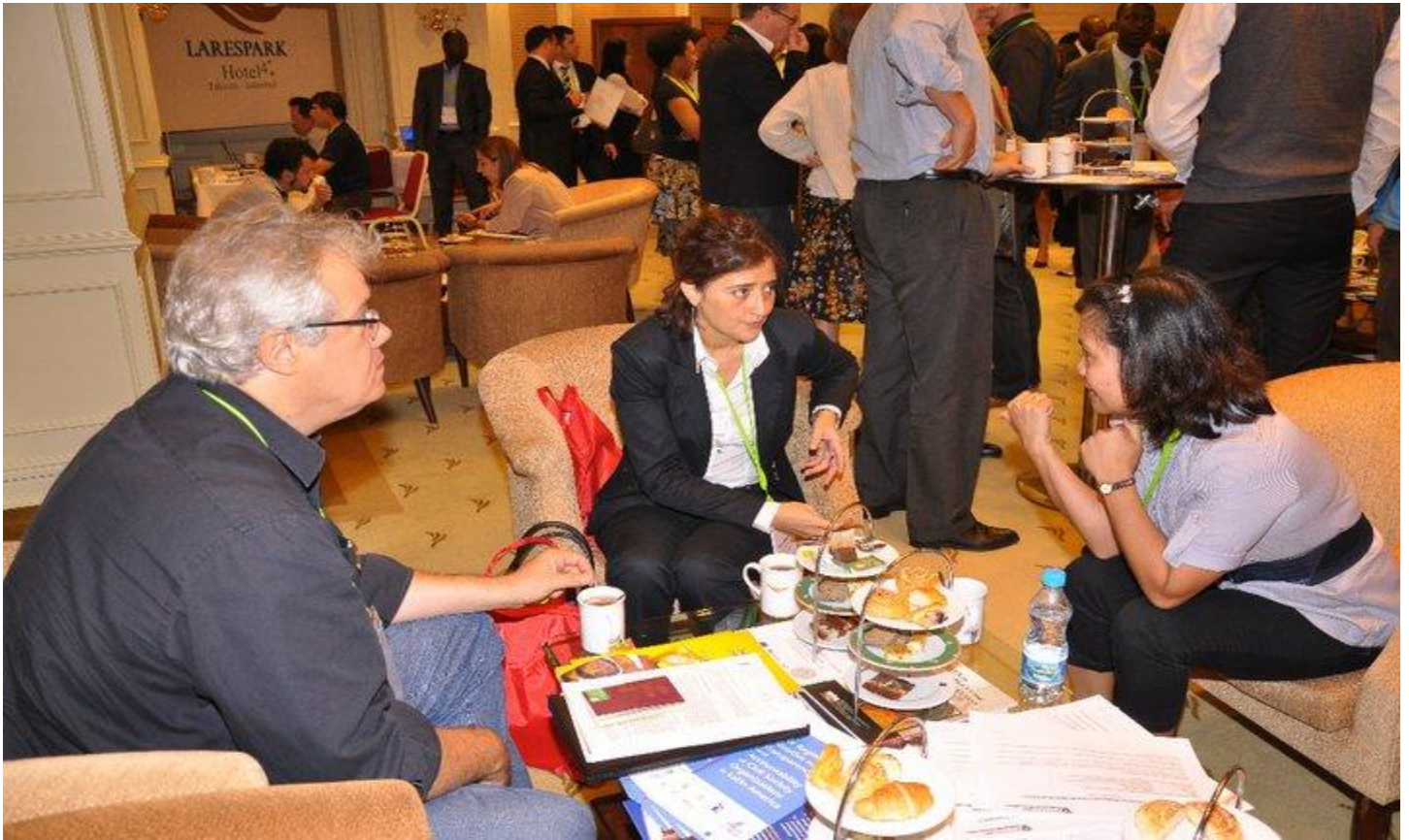
Figura 3: Participantes discutiendo los Principios para la Eficacia al Desarrollo de las OSC.

Después que la sesión plenaria terminó, los participantes fueron invitados a un cóctel en el bar del hotel Larespark. Mientras esta actividad se llevaba a cabo, un pequeño grupo de redacción se reunía para discutir los cambios propuestos en los Principios para la Eficacia al Desarrollo de las OSC, y prepararon un nuevo borrador de los principios para ser presentados en día siguiente.