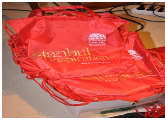
Figura 2: Muestra del bolso de la Asamblea Mundial, que se entregó con documentos clave.

Los participantes que se registraron en línea fueron recibidos en el lobby del Hotel Larespark, donde se les entregó una copia del programa para los tres días de la asamblea, junto con un bolso de la conferencia que contenía documentos relevantes relacionados al trabajo del Foro, incluyendo el borrador del Marco Internacional Global y el Informe de Síntesis (en Inglés, Francés y Español); una memoria USB con todos los documentos clave en formato electrónico, como así también información práctica sobre Estambul y la Asamblea Mundial.