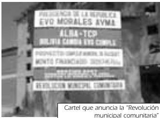
Cartel que anuncia la "Revolución municipal comunitaria"

EL 21 DE MARZO PASADO, el presidente Evo Morales entregó cheques para 22 pequeños proyectos de infraestructura deportiva en Villa Pagador, dando así respuesta efectiva a la solicitud que le hicieran semanas atrás los dirigentes vecinales. Más allá de los detalles técnicos de estas obras es necesario hacer una evaluación y análisis de lo que implica la realización de ellas, frente a las grandes necesidades y desafíos que tiene la población de los barrios de la zona sur.