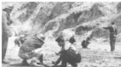
Mineros minando la pista de Catavi para evitar que aterricen tropas. Arriba, Barrientos y Ovando. A lado, el desaparecido dirigente Issac Camacho.

vidas obreras fueron cegadas. Los mineros de Catavi, viendo la masacre cometida en Siglo XX y Llalagua asaltaron el desguarnecido Cuartel General acantonado en el lugar y que había sido vaciado para reprimir a Llalagua. Los obreros redujeron a los centinelas y se hicieron de armas y munición. El Ejército burlado, una vez aplacada la resistencia de Siglo XX, volvió furiosa sobre Catavi. Eran las dos de la tarde de día 21 de Septiembre de 1965. Los mineros ofrecieron combate en los campos de Huairapata, la lucha fue encarnizada, pero cuando los mineros resistían heroicamente entró en acción la Fuerza Aérea con aviones AT-6 y Mustag F-51 que ametrallaron incesantemente las fuerzas mineras. El bombardeo de la aviación sobre los campamentos y la entrada del Regimiento Braum 8° de Caballería arribada desde Santa Cruz, terminó por rendir a los mineros. Esta triste página del movimiento popular, donde cayeron más de 200 entre trabajadores y algunos soldados, esta opacada sólo por otra masacre muy cercana no más cruenta aunque sí más dramática, la masacre de San Juan ocurrida dos años más tarde.