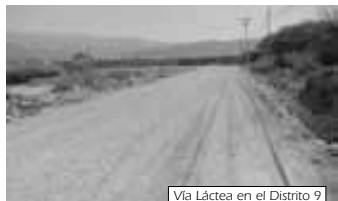
Vía Láctea en el Distrito 9

En el caso de los empedrados en la OTB 21 de Diciembre, éstos contemplan 3 calles. El financiamiento proviene de recursos de participación popular que tenía el barrio de varias gestiones.