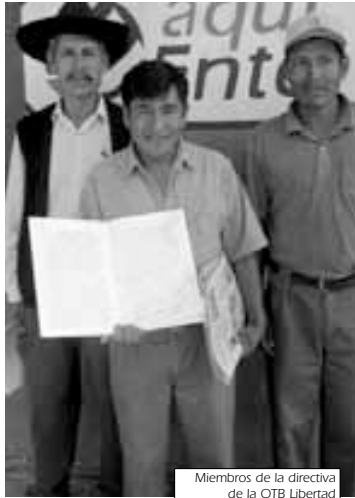
Miembros de la directiva de la OTB Libertad

La OTB cuenta con 315 adjudicatarios, es decir esta zona tiene 315 lotes de los cuales la mayoría se hallan habitados. Los pobladores de la OTB son de distintas partes del país pero en su mayoría de La Paz, Oruro, Potosí, Chuquisaca y de distintos lugares de Cochabamba.