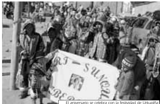
El aniversario se celebra con la festividad de Urkupiña

Los días 30 y 31 de agosto también en Urkupiña se celebró la festividad de la virgencita que da nombre a la zona. Tres fraternidades (tinkus, morenada y salay) demostraron su devoción hacia la patrona de los vecinos que despidieron el mes de agosto de fiesta y con mucha alegría.