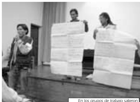
En los grupos de trabajo salieron interesantes planteamientos

organizan eventos municipales de evaluación de la gestión que estén abiertos a toda la población.