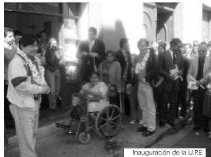
Inauguración de la U.P.E.