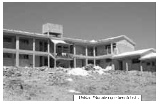
Unidad Educativa que beneficiará a los niños de Alto Buena Vista

Si bien el plan de expansión es una respuesta a la necesidad del agua, el otro tema que debe ser solucionado es el tema del alcantarillado, este es un desafío para los dirigentes.