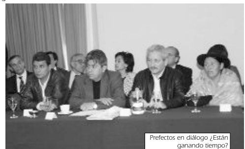
Prefectos en diálogo ¿Están ganando tiempo?

Las organizaciones populares saben que la única forma para derrotar a la oligarquía es no dejar la movilización, lo contrario sólo le da el espacio que necesita para armarse nuevamente. Por otra parte la única garantía para que sus conquistas reflejadas en la nueva CPE no sean negociadas a sus espaldas, es que expresen y le den el mandato al gobierno de no modificar el texto constitucional y convocar inmediatamente al referendo de aprobación de la nueva CPE. Si el gobierno y el movimiento popular no pasa a la ofensiva, la derecha retomará la violencia y buscará nuevamente derrocar al gobierno y masacrar al pueblo.