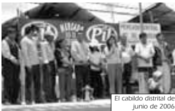
El cabildo distrital de junio de 2006

EN EL MES DE AGOSTO se cumplió un año del nuevo Consejo Distrital, un "Consejo Distrital del cambio". El mismo ha cumplido la mitad de su gestión y a esta altura se hace necesario evaluar el camino recorrido hacia el cambio demandado por los vecinos y las organizaciones.