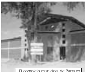
El complejo municipal de Racquet

Sobre el Proyecto de Parque Lincoln el parque se fue ejecutando hace años atrás por fases. La fase III corresponde ejecutarse en esta gestión y está todavía en plena ejecución.