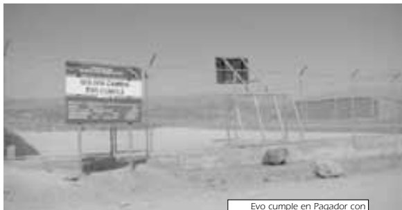
Evo cumple en Pagador con canchas multifuncionales

En este punto no hay, al parecer, una diferencia notable entre lo que hace la Alcaldía y lo que hacen estos proyectos del Programa "Evo Cumple". Desde hace algunos años atrás en la zona sur se critica a la Alcaldía por la lógica que predomina en su política de inversión: la lógica de las obras vistosas que somete a