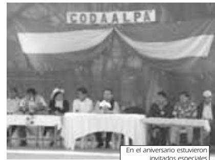
En el aniversario estuvieron invitados especiales

Los trabajos que se van a realizar con este