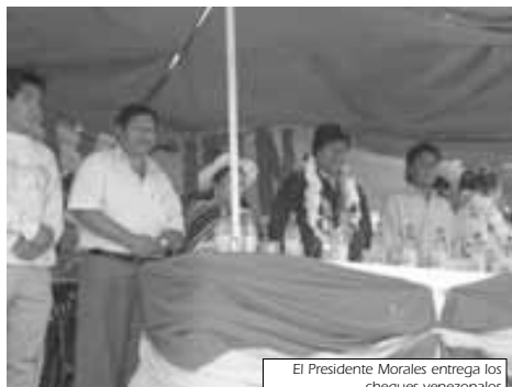
El Presidente Morales entrega los cheques venezolanos

En la valoración que hace otra de las entrevistadas, refiere que "este Programa está bien para nosotros porque son obras que se ven". Es un criterio muy común en nuestro medio a la hora de valorar las acciones de las autoridades y dirigentes: lo vistoso, lo que entra por los ojos, sin embargo, por más que este criterio sea ampliamente aceptado por la población, es necesario contraponerlo a la necesidad –valorada también por la población, en su sano juicio– de una solución estructural y duradera a los problemas que aquejan a los barrios marginales.