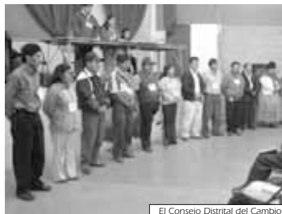
El Consejo Distrital del Cambio cumplió media gestión

están más abocados en el “peguismo”, de avalar a las personas que vayan a trabajar (a la Prefectura). Hay proyectos que se han ejecutado con el programa Evo Cumple, pero el presupuesto de la Alcaldía sigue igual. ¿Dónde está la participación popular?. No es gozar solamente del gobierno, sino también hay que exigir la plata de la Alcaldía. Es también nuestro derecho exigir la participación popular, los recursos propios de la Alcaldía”.