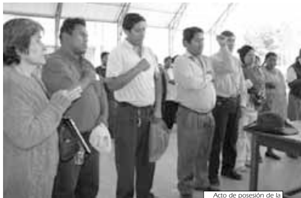
Acto de posesión de la nueva Directiva

CUANDO UNA ORGANIZACIÓN POPULAR no apunta a la transformación de una determinada realidad, ni se organiza, funciona o se activa, se desvirtúa su naturaleza y tiende hacia su estancamiento y desaparición. Para que esto no suceda en Valle Hermoso Norte los vecinos demandaron desde hacia tiempo se regularicen las reuniones de la OTB y pueda tratarse colectivamente los temas que preocupan a la vecindad.