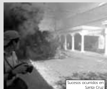
Sucesos ocurridos en Santa Cruz

Frente a este escenario tan evidente, ¿Será que estos grupos han perdido el norte y que carentes de ideas apelan simplemente a desplegar recursos violentos que no condicen con los conceptos de desarrollo y progreso que lo manejan muy bien en el plano retórico y lírico?