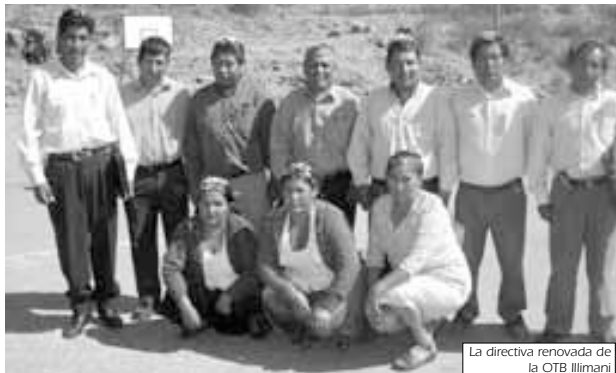
La directiva renovada de la OTB Illimani

Los representantes reelegidos dieron un informe global de todas las actividades que vienen desarrollando. La nueva directiva y los vecinos de esta zona festejaron este día tan importante con una merienda comunitaria.