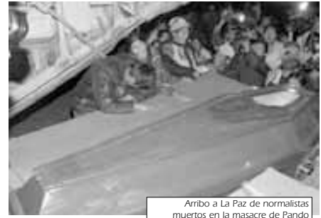
Arriba a La Paz de normalistas muertos en la masacre de Pando

Lo cierto es que la intervención militar y el estado de sitio en Pando, fue más simbólico que real y el gobierno hasta ahora no ha reestablecido el orden y garantizado los derechos humanos en ninguna de las regiones atacadas por los grupos de criminales. Hasta el día de