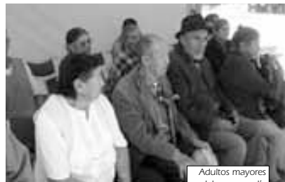
Adultos mayores celebraron su día