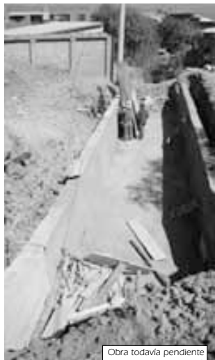
Obra todavía pendiente en el Distrito 8

Los datos de estos cuadros muestran que ni aún la mísera plata de la Alcaldía se presupuesta para los barrios marginales se ejecuta. Algo habrá que hacer.