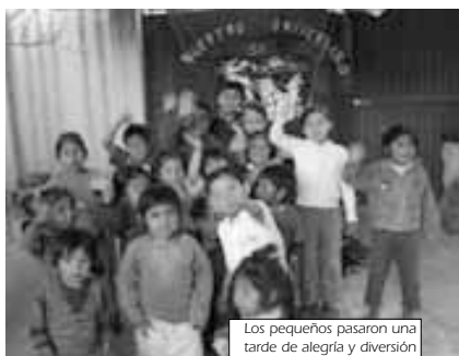
Los pequeños pasaron una tarde de alegría y diversión

EL 17 DE AGOSTO PASADO el Hogar Comunitario Los Rosales cumplió 5 años de vida y celebró su quinto aniversario el martes 2 de septiembre con un pequeño acto en el que los principales invitados fueron los niños y niñas de la zona de Alto Pagador homenajeados por las madres y educadoras del hogar.