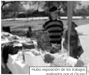
Hubo exposición de los trabajos realizados por el Grupo

motivaron para reunirnos, consiguiendo en este tiempo importantes logros, como el contar con Carnet de Identidad desde el inicio del cobro de lo que hoy es el Bono Dignidad, la afiliación al Seguro Médico de Vejez, presencia en la directiva de Adultos Mayores de Cochabamba (aunque se