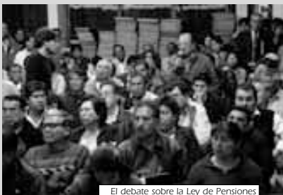
El debate sobre la Ley de Pensiones devela muchas inconsistencias