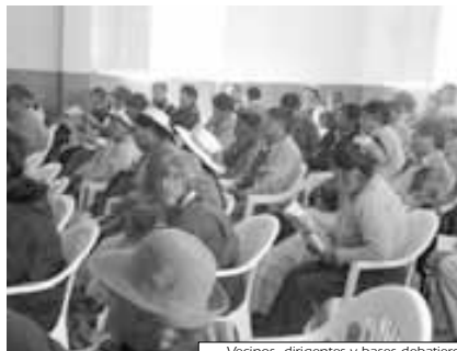
Vecinos, dirigentes y bases debatieron en torno a la gestión municipal

Pero la falta de participación va más allá ya que la elaboración de los POAs, se limita a la aprobación del Comité de Vigilancia y de algunas instancias distritales y de OTB, pero casi nunca se