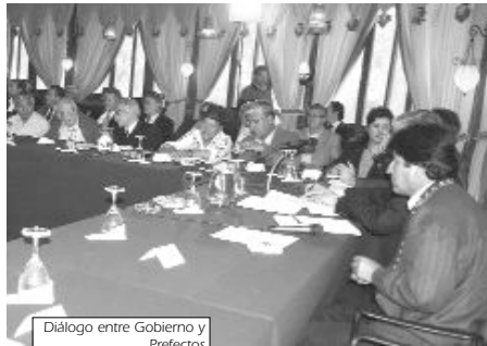
Diálogo entre Gobierno y Prefectos

Se debe criticar duramente la actitud del gobierno de no haber garantizado la vida de campesinos, indígenas y población interviniendo antes de la masacre de Pando, como era su obligación. También criticar su falta de firmeza para castigar a los prefectos y cívicos responsables y aún más el haberles dado legitimidad para establecer el diálogo, permitiendo la impunidad.