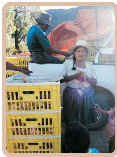
Compra de pollitos

Además de la capacitación técnica, el aprendizaje de la preparación de alimentos y sanidad animal, las 12 familias que participaron del proyecto, tienen el fin de seguir ampliando y desarrollando la diversificación productiva local y sostenible.