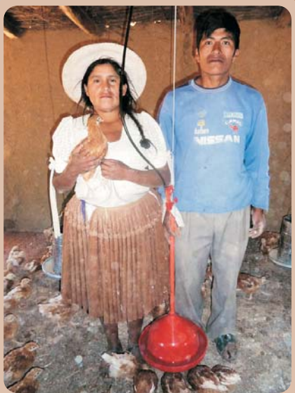
Espacio para la cría de pollitos