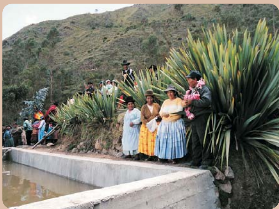
Inauguración del estanque de agua