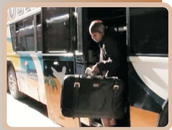
Captura del video “Un viaje imprevisto”