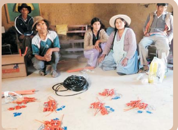
Familias con los materiales para el emprendimiento del proyecto.

Con el apoyo técnico de las instituciones avales, la organización ha tenido tres tipos de resultados; por un lado la organización se ha fortalecido, desarrollando capacidades en producción y comercialización por una iniciativa común.