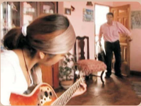
Captura del video "Un viaje imprevisto"