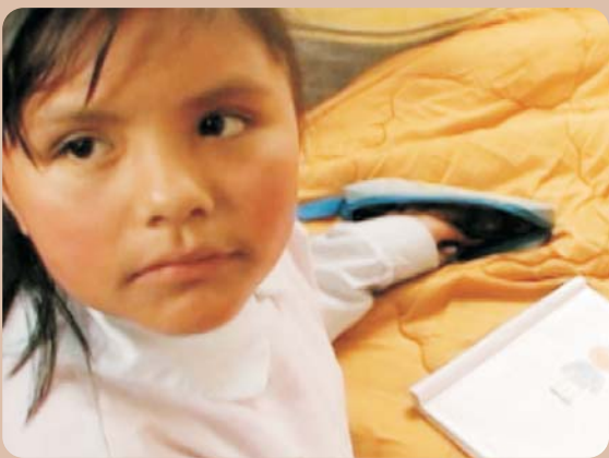
Captura del video "Un viaje imprevisto"