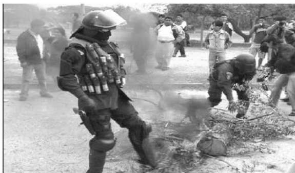
Bloquearon la avenida de ingreso a la Sub Alcaldía del Distrito 4

Fundidores, chapistas y mecánicos de la zona de Alto San Pedro bloquearon la radial 16 frente a la Sub Alcaldía del distrito 4. La protesta fue por abusos cometidos por los gendarmes municipales en los operativos. Posteriormente los dirigentes lograron reunirse con autoridades municipales para buscar una solución al problema.