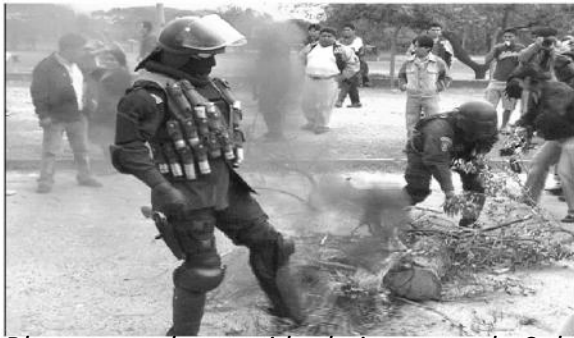
Bloquearon la avenida de ingreso a la Sub Alcaldía del Distrito 4

Fundidores, chapistas y mecánicos de la zona de Alto San Pedro bloquearon la radial 16 frente a la Sub Alcaldía del distrito 4. La protesta fue por abusos cometidos por los gendarmes municipales en los operativos. Posteriormente los dirigentes lograron reunirse con autoridades municipales para buscar una solución al problema.