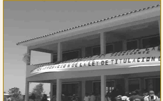
MÓDULO EDUCATIVO "24 DE MARZO" DEL BARRIO GERMAN BUSCH