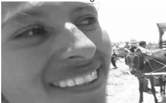
Una de las primeras profesoras, feliz de ver la obra hecha realidad

Repetidas veces pidieron a la Alcaldía la construcción de una escuela, pero esta cerró sus oídos. Fue entonces que el año 2007 el programa de televisión ZAMBACANUTA, producido por el Programa Desarrollo del Poder Local, hizo un reportaje sobre la escuelita, que logró ver hasta el mismo presidente de la república, quien pidió un informe que explique cómo era posible que hayan tantos niños y tantas niñas sin escuela. Le explicaron que la construcción de escuelas es competencia municipal con fondos que el gobierno da a los municipios y que, a pesar que en los últimos años se aumentó la cantidad de dinero para los municipios (en algunos casos hasta triplicándolo), muchos, como el caso del municipio de Santa Cruz de la Sierra, demostraron su ineficiencia y apatía hacia las necesidades de la gente.