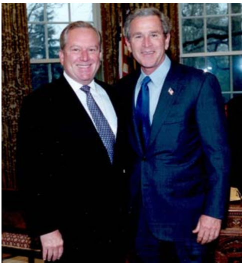
Otto Reich y George Busch

abierto con el mismo Otto Reich que representaba a la compañía interesada en controlar Hondutel. Ante la negativa de Zelaya de aceptar el contrato con la empresa representada por Reich, éste lanzó una serie de acusaciones contra Zelaya y su gobierno que se mantuvo abierta en la prensa hondureña y la estadounidense con alto perfil, hasta que en abril del 2009, el presidente Zelaya envió una misión a Miami para contratar un bufete de abogados e iniciar juicio contra el Sr. Reich acusándolo de calumnias, difamación y de impulsar acciones oscuras y sucias en Centroamérica.