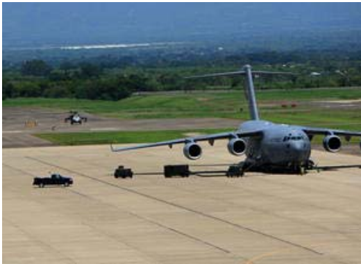
Base Soto Cano (Palmerota) Honduras

naciones latinoamericanas y desde la que se articulan acciones militares en correspondencia con la necesidad norteamericana de sostener su influencia política y militar en la región. En los años 80 desde Palmerola se instruyó y se organizó a los “escuadrones de la muerte”, aparatos represivos paramilitares que asolaron El Salvador, Guatemala, Nicaragua y la propia Honduras dejando miles de muertos y desaparecidos. Es desde esa base dependiente del Comando Sur del Ejército de EEUU que se han orquestado la invasión a Granada, el secuestro de Aristide en Haití y más recientemente el golpe de Estado contra Venezuela en el año 2002.