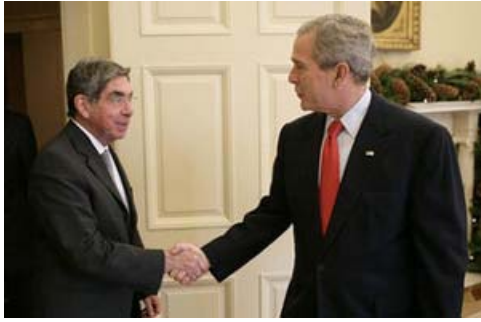
Oscar Arias y George Busch